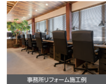
事務所リフォーム施工例