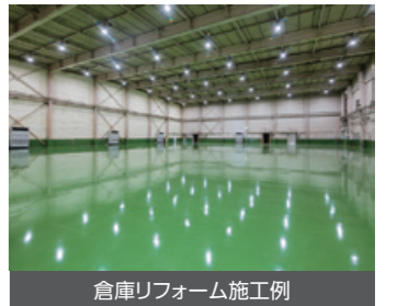
倉庫リフォーム施工例