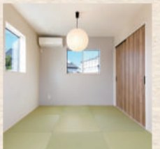
第3位：フチなし畳の シンプル和室