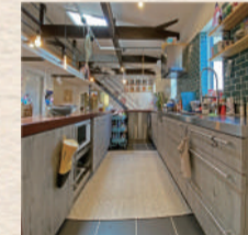
第2位：コの字キッチン