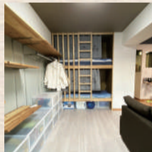
第1位：マンションリノベ 押入れをベッドに!