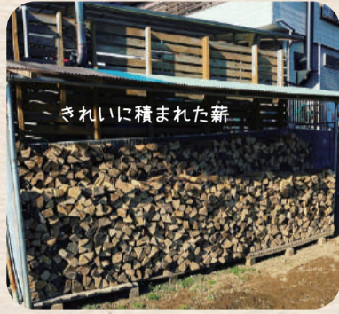
きれいに積まれた薪

猪狩農園の今の時期は、できる野菜の品目が少なくなっています。大根や白菜を収穫する中、山で伐採した木々を薪割して、薪ストーブに使っています。たくさんの薪積みがどこか懐かしい気持ちになります。