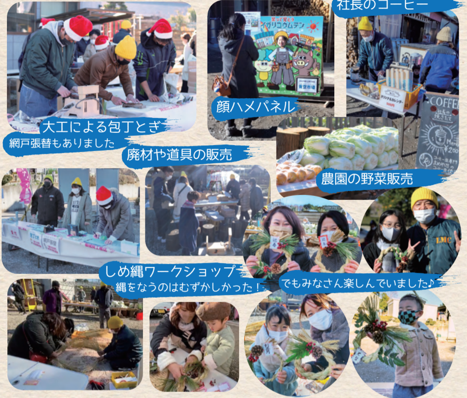
大工による包丁とき 網戸張替もありました

12月18日(土)に無事青空市場を開催させて頂きました。晴天でしたが風が強く冷たい中、いつもとは違う内容に関わらずご参加くださったみなさまありがとうございました!!