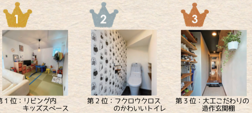
第1位: リビング内 キッズスペース